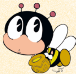
新しい風、生涯学習 生涯学習マスコット 「マナビィ」