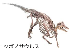
ニッポノサウルス 全身骨格レプリカ (所蔵：国立科学博物館)