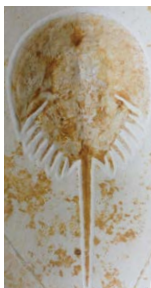
カブトガニ現生資料・化石(所蔵：いわき市石炭・化石館)