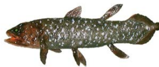
シーラカンス現生(所蔵：茨城県自然博物館)・化石(所蔵：いわき市石炭・化石館)