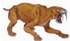
サーベルタイガー生態復元画