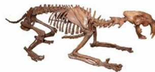
サーベルタイガー 全身骨格レプリカ (所蔵：茨城県自然博物館)