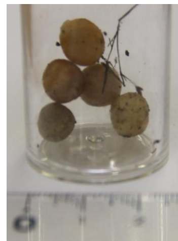
図3 セアカゴケグモの卵のう