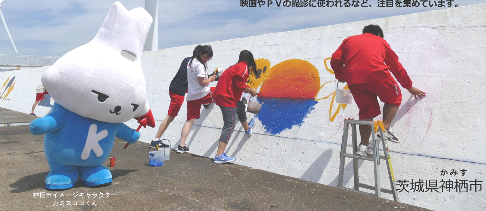
神栖市イメージキャラクター カミスココくん

『1000人画廊』は 市民の皆さんの手によって描かれた 壁画が並ぶ神栖市の観光スポットです。 海岸線に立ち並ぶ風力発電施設と護岸壁の絵画は、その景観の美しさから 映画やP Vの撮影に使われるなど、注目を集めています。