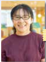
子育てサポーター