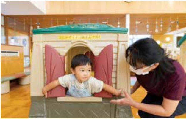
子どもが何をしたいか見守り、楽しく遊べるよう寄り添ってくれる子育てサポーター。サポート場所に児童館を選ぶこともできる。

手厚い支援策の一つが、ファミリーサポートセンターです。例えば小さいお子さんがいるママやパパにとって、結婚式に招待されたとき、病院に通いたいとき、仕事