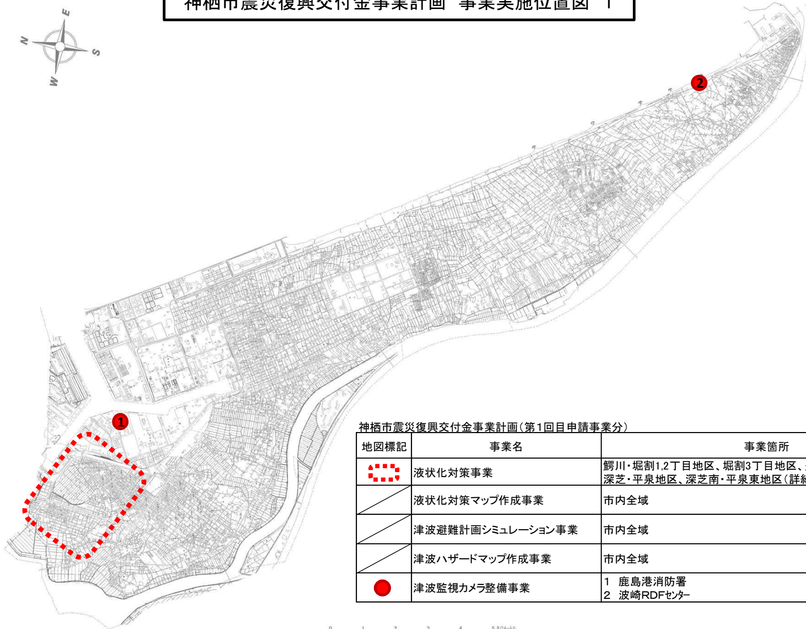
神栖市震災復興交付金事業計画(第1回目申請事業分)