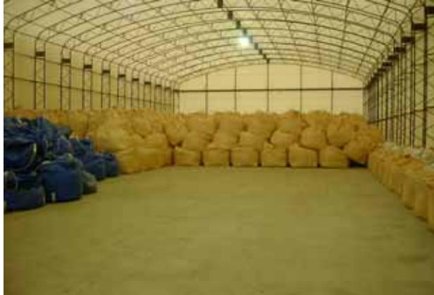
土壌分級後の保管状況

平成18年度は汚染土壌等の本格処理に向けて、土壌等を密閉容器に詰める業務等を引き続き実施する予定です。新しい請負業者は4月下旬以降に決定する予定です。