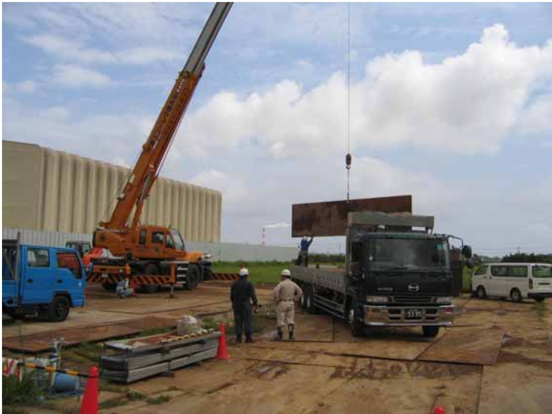
仮設資材の撤去作業

残りの作業についても、安全対策、環境対策に万全を講じて進めてまいりますので、引き続き御協力の程宜しくお願い致します。