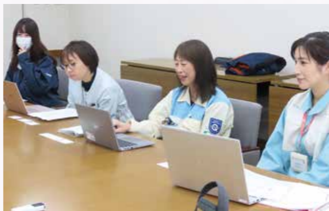
活動について楽しく話してくれたメンバーのみなさん

最初は、どのような感じなのか、皆さんにメリットがあるようなことをお伝えできるのか、とても不安でしたが、他