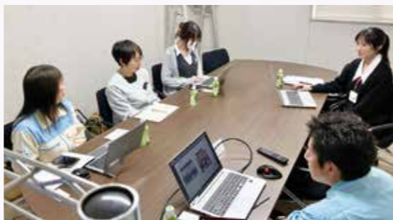
神栖Cross Linkの活動の様子 「毎回、あっという間に時間が過ぎてしまいます！」

「DE&I」をテーマに各社と情報共有をおこない、より良い職場環境づくりの促進を図っています。