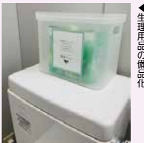
生理用品の備品化