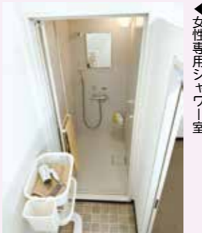
女性専用シャワー室