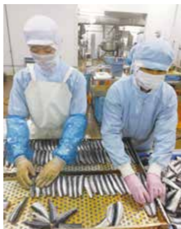
工場内の作業風景