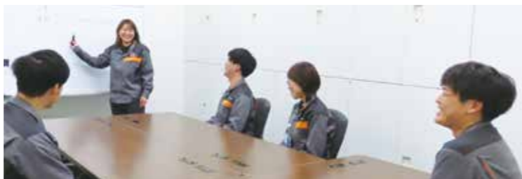
事務課 ミーティング風景

お話を伺い、女性の働き方や活躍について、前向きに検討されていることが理解できました。ハラスメントに関しては、よく「パワハラ」という言葉を聞きますが、パワハラにグレーゾーンがあるということを知りました。例えば、上司が忙しそうなお雰囲気や態度をとっているため、質問したい部下が質問できない状況のことなどです。このような事例は厚生労働省のホームページに具体的な動画があります。気になる方は是非ご覧ください。