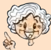
(イラスト：F ためかわ)

はじめまして。私はハートフルお婆ちゃんです。神栖市生まれの神栖市育ち、エッ！年齢？女性に年齢なんて聞くものじゃねえよ！ ナイショ！