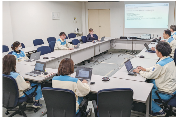
プロジェクトチームの会議の様子 メンバーそれぞれ活動テーマを持って主体的に取り組みを実施しています