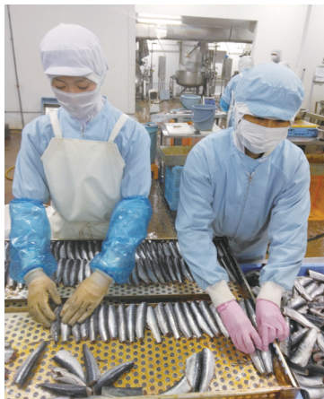
工場内の作業風景