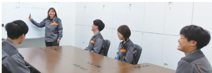
事務課 ミーティング風景

お話を伺い、女性の働き方や活躍について、前向きに検討されていることが理解できました。