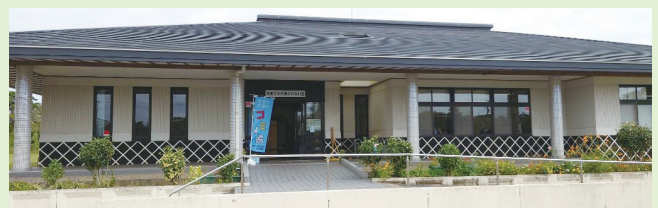
矢田部ふれあい館 外観

コミュニティセンターの一員として私が大切にしていることは、地域や利用者と共に安全・安心そして健やかに過ごせる地域づくりのために、皆さんと共に学び貢献することだと考えています。