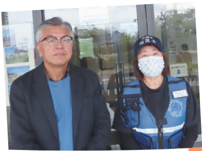
地域をつなぐ女性防災士