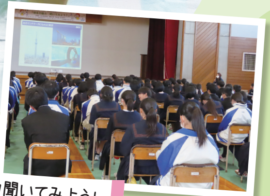
理系の魅力聞いてみよう!