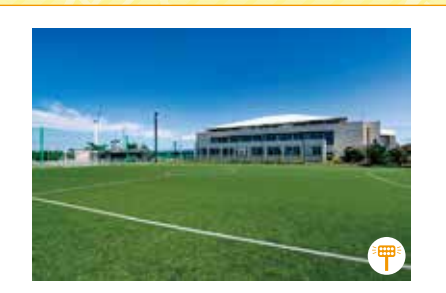
豊ヶ浜フットサル