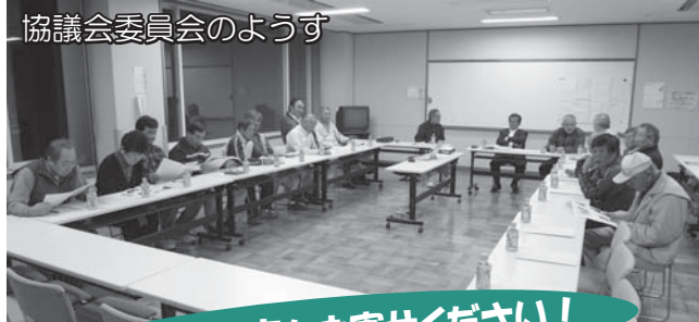
協議会委員会のようす

安全で住みよいまちづくりを目指し、活動を重ねてきましたが、地域の人口減少や高齢化など、地域を取り巻く課題は日増しに大きくなっており、住環境整備事業に限らず、地域の魅力づくりについても重要な検討課題となっています。