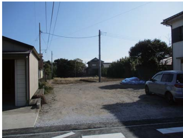
市道1450号線整備予定地