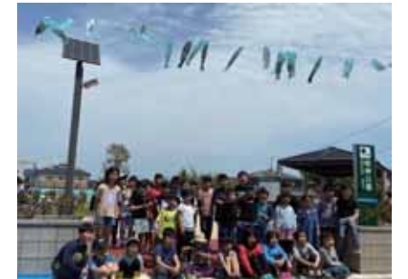
明神公園開園イベント

内容は、「波崎小学校の子どもたちが制作した“鯉のぼりの展示”」「公園入口看板の“手形やペンキ絵による装飾”」「波崎小学校の子どもたちから募集したデザイン案をもとにした“花壇への花植え”」です（鯉のぼりは5月1日～5日の5日間展示しました）。