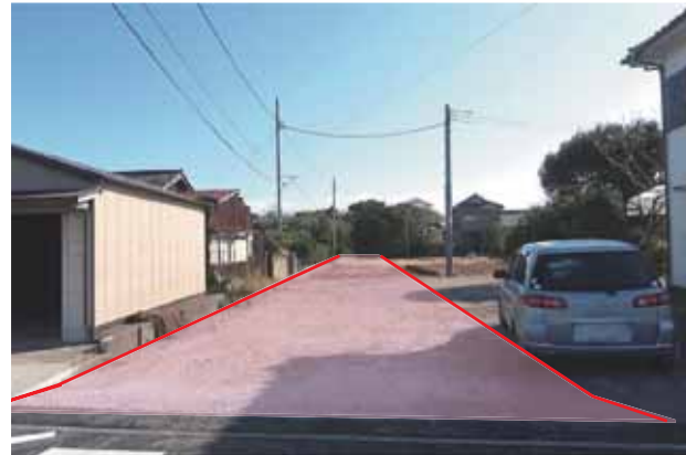
市道1450号線整備予定地