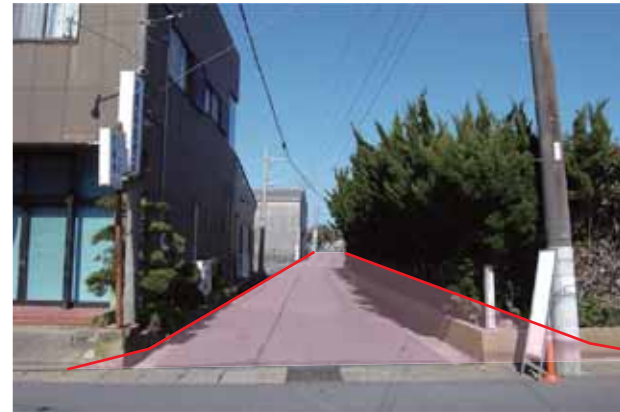
市道1015号線整備予定地