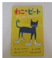
エリック・リトウィン さく ひさかたチャイルド

秋が深まり、全国に紅葉のたよりが届き始めました。読書の秋！幼稚園では、毎日読み聞かせをしたり、絵本や物語に触れられるように環境を整えています。今月は**先生のおすすめ絵本を紹介します。