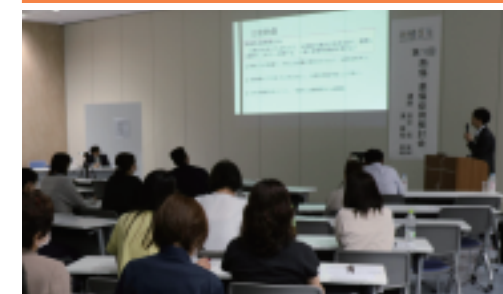
熱傷・薬傷症例検討会には延べ483人が参加

今後も、幅広い方々の賛同と参加を得て、裾野を大きく広げ、あるべき姿・高みを目指して一歩一歩登っていきたいと考えています。