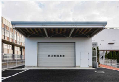
防災備蓄倉庫 60㎡ 食料等や防災用資機材を備蓄