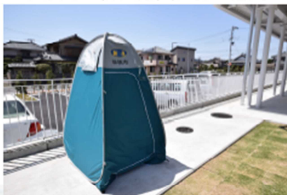
マンホールトイレ 3基