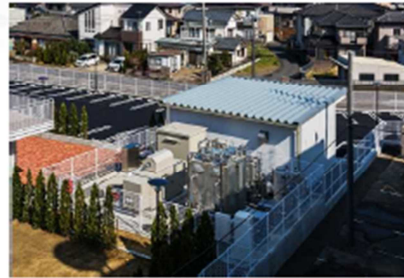
自家用発電機 84時間稼働可能