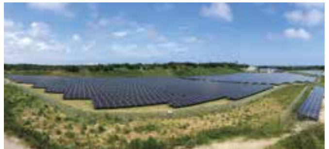
JRE波崎北太陽光発電所