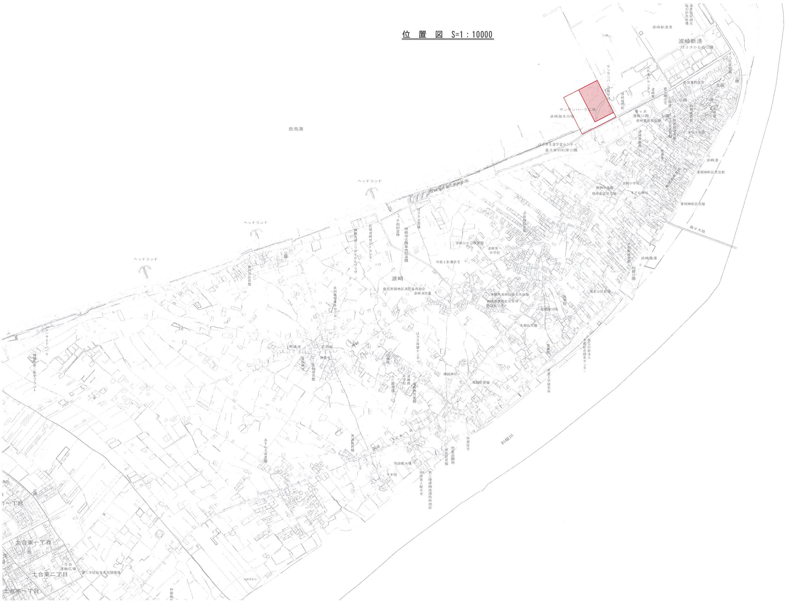
位置図 S=1 : 10000