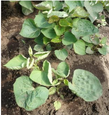
株の葉巻、萎縮症状