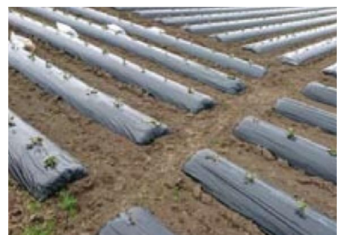
枕畝途中に設置した排水路