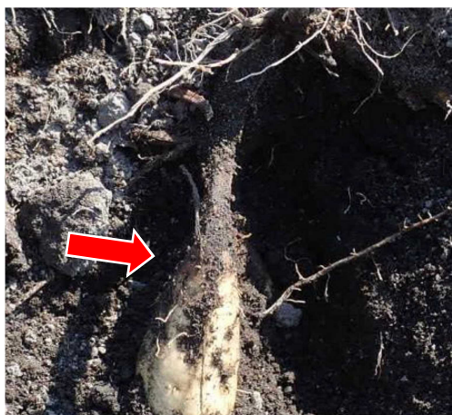
黒変がなり蔓から塊根へ到達