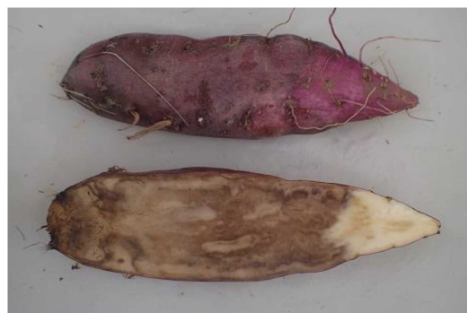
なり首側からの塊根腐敗