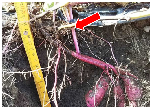
黒変が茎基部からなり蔓へ