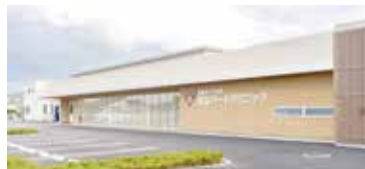
宝山ハートクリニック

宝山ハートクリニックでは、市の「高度医療機器支援事業補助金」を活用してMRIを設置しました。これまで平泉の鹿嶋ハートクリニックで画像検査などを行っていましたが、現在は宝山ハートクリニックでも検査が受けられる体制となっています。