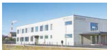
かみす中央メディカルクリニック

かみす中央メディカルクリニックでは、利用者からの消化器疾患の相談に答えるため、新たに消化器内科を設置し医師を採用。内視鏡検査装置を市の「診療体制強化事業費補助金」を活用して購入し、クリニック内で検査・診断が行えるようになりました。