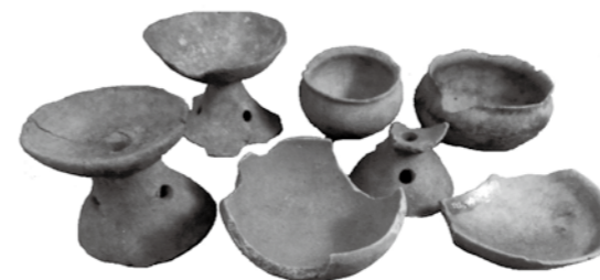
海老塚遺跡出土土器群 (古墳時代)