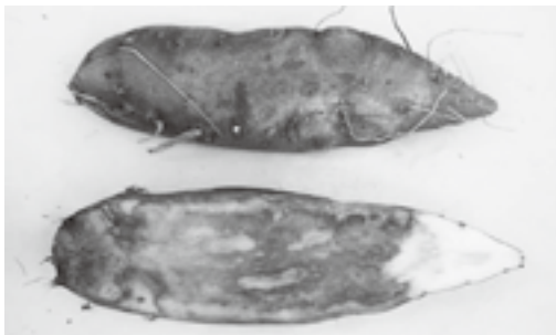
なり首側からの塊根腐敗