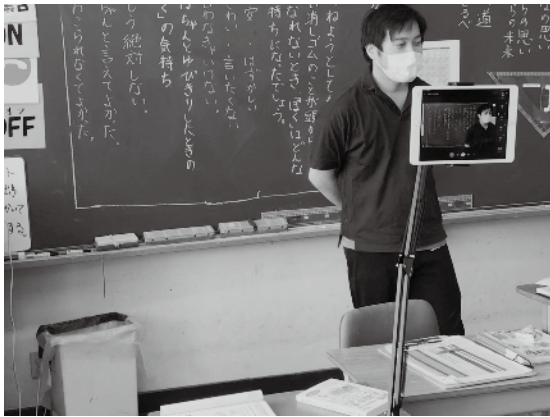
オンラインによる学習内容の配信

小中学校ではタブレットやWi-Fiなど、オンライン環境の整備や授業でのICTの活用に取り組み、2021年9月の緊急事態宣言下では、オンライン学習を本格的に実施しました。