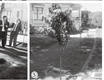
①1991年11月17日ユーリカ市と姉妹都市提携 ②2006年姉妹都市親善訪問 ③神之池緑地内ガゼーボ(2015年) ④2019年カミスパーク(ユーリカ市)で桜の植樹 ⑤現在のカミスパークの桜