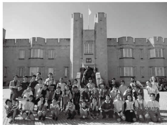
ブリティッシュヒルズ

10月にオープンした神栖市教育センターでは、小学校高学年を対象としたイングリッシュワンデイキャンプを実施し、英語に慣れ親しむ環境を提供します。