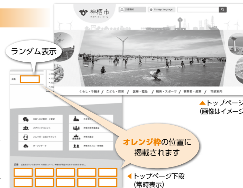
▲トップページ(画像はイメージ)