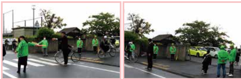
神栖第四中学校校門前にてあいさつ運動を行う。

コミ協が行う、あいさつ・見守り活動は、これまで大野原小学校と西小学校で実施してきましたが、今年度から神栖第四中学校においても朝のあいさつ運動を実施することとなりました。あいさつ運動、見守り活動はコミ協発足以来、継続している活動ですが、朝のあいさつ運動への参加人数も増えていることや部会から提案が出されたことから、今年4月から神栖第四中学校でも「朝のあいさつ運動」行うことになりました。毎月第3月曜日の活動日には3校そろってのあいさつ運動が行われます。地域の方々も児童・生徒へのあいさつや声掛けなどをお願いします。