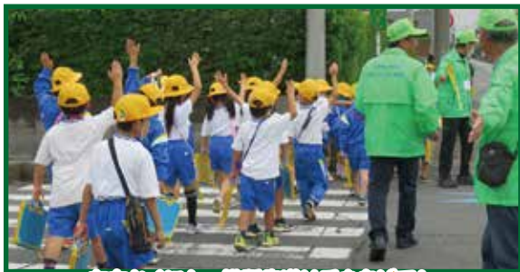
左右かくにん、横断歩道は手を上げて!