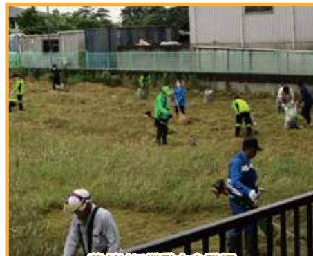
草刈りに機動力を発揮