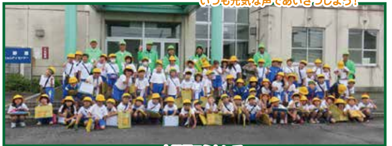
大野原コミセンで