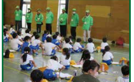
いつも元気な声であいさつしよう!