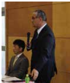
顧問の先生より祝辞