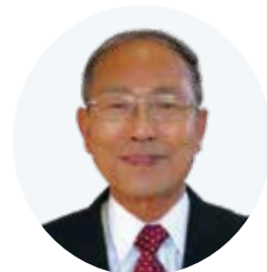
神栖四中学区地域 コミュニティ協議会

神栖市のモデル地区としてスタートしたコミュニティ協議会も、今年発足10周年を迎えることになりました。地域活動を続けることは難しいといわれていますが、10年もの間途切れることなく活動を継続できたことは、発足当初にみんなで決めた協議会理念に基づいて、協議会と地域の人々が共に努力し協力して取り組んできたことに他ならないと思っております。10年の間にコミ協の運営や活動は着実に深化し成果も出ていますが、一方では地域のつながりはより希薄化している現実があります。コミュニティの衰退が進む厳しい状況下ではありますが、コミ協活動の果たす役割とその意義は重要であると考えています。引き続きみんなで力を合わせて、住みよいまちづくり活動を進めていきたいと思っております。10周年を迎え新たな気持ちで持続可能なコミ協活動を進めていきたいと考えますので、ご協力をよろしくお願い致します。