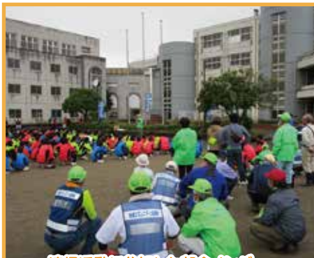
清掃活動に参加した部会メンバー