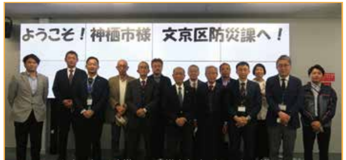
文京区役所防災課 防災本部大型モニター前で