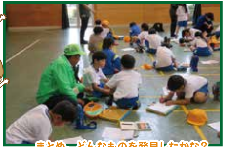
まとめ。どんなものを発見したかな?

9時に学校を出発。まちの様子や通学路の様子などを観察し、大野原コミセンで休憩とまとめ。コミ協参加者一人一人から、「登下校時の注意や元気であいさつすることの大切さ」などの話を聞いた後、大野原コミセンを出発し11時15分に学校に戻りました。地域と学校が連携して「地域の子どもたちは地域みんなで育てる」との気持ち持って、子どもたちが健やかに成長する姿を見守っていきたいと思います。