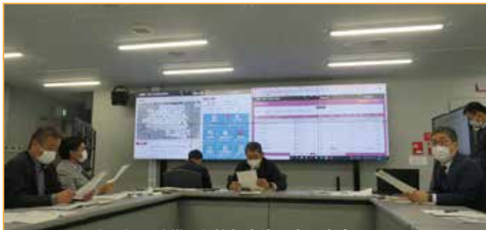
文京区役所防災課と情報交換、意見交換

防災活動の一連の説明を受け、文京区の災害に対する取り組みや住民の災害に対する意識の高さなどには驚きました。文京区との情報交換で得た知識や情報は、今後のコミ協活動に生かすことのできる有意義な視察研修でした。