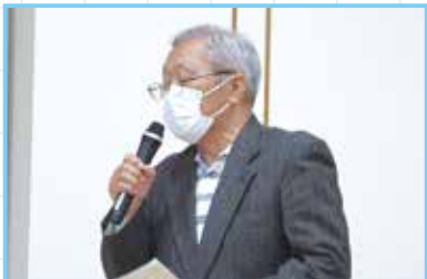
古川副会長あいさつ