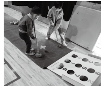
ビンゴだボードの体験風景