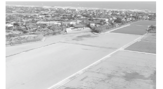
【整備状況写真(2023年3月末時点)】