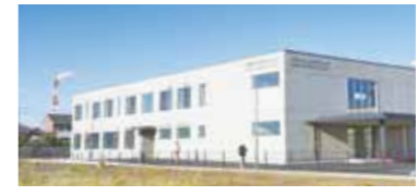
かみす中央メディカルクリニック

かみす中央メディカルクリニックでは、利用者からの消化器疾患の相談にこたえるため、新たに消化器内科を設置し医師を採用。内視鏡検査装置を市の「診療体制強化事業費補助金」を活用して購入し、クリニック内で検査・診断が行なえるようになりました。