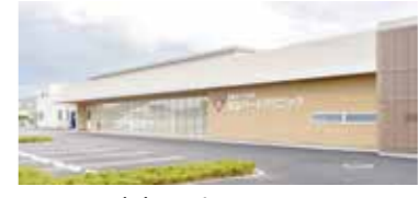
宝山ハートクリニック

宝山ハートクリニックでは、市の「高度医療機器支援事業補助金」を活用してMRIを設置しました。これまで平泉の鹿嶋ハートクリニックで画像検査などを行なっていましたが、現在は宝山ハートクリニックでも検査が受けられる体制となっています。