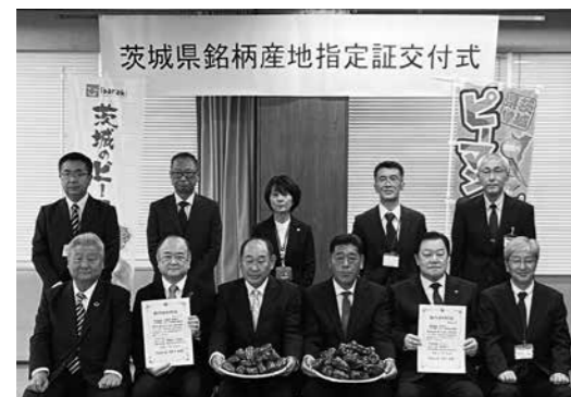
銘柄産地の指定を受けた神栖市・鹿嶋市のみなさん