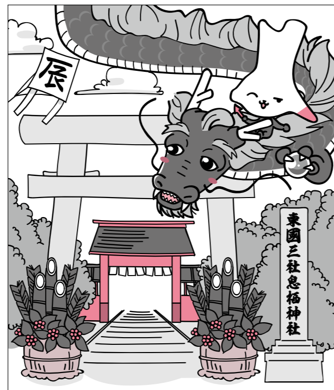
※カミスココくんのイラストは、まちがいさがしクイズ用に特別に加工したものです