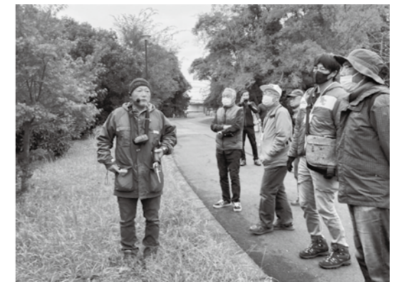
第3回ワークショップ現地確認の様子

申込方法=問合先窓口・電話・FAX・メールで申し込み(FAX、メールで申し込みの場合は、住所、氏名、連絡先を記載)