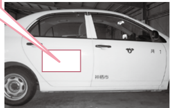
▲公用車側面(イメージ)