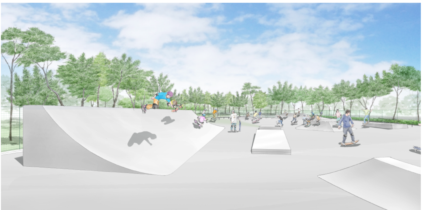
整備イメージ (スケートボードパーク)