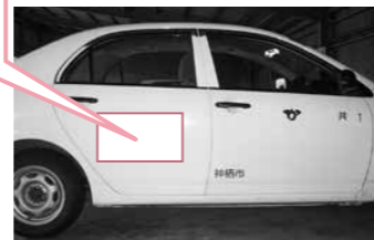
▲公用車側面(イメージ)