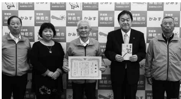
左から大高事務局長、吉川副会長、岩井会長、石田市長、保科副会長

いただいた寄付金は今後、まちづくりのために役立てていきます。ありがとうございました。