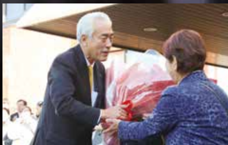
12月8日、木内敏之市長が初登庁し、就任式後の記者会見で抱負を語りました。