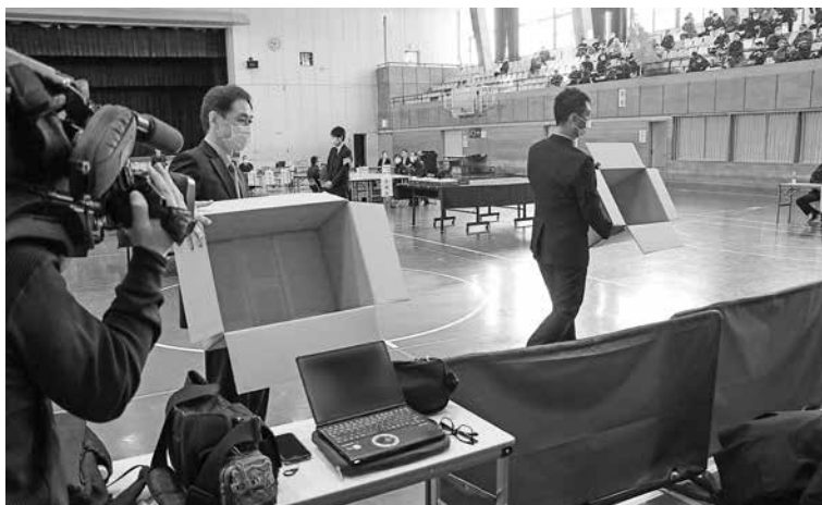
市民と報道陣が見守る中おこなわれた開披再点検の様子