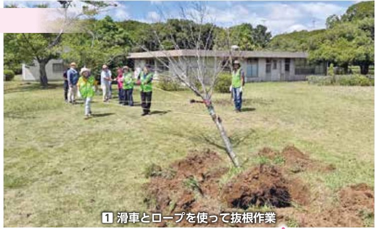
1 滑車とロープを使って抜根作業