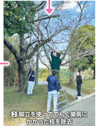
2 脚立を使っててんぐ巣病にかかった枝を除去

シノ3本、オオシマザクラ2本の計6本を植樹いただいています。 堆肥の「神栖ブレンド」を