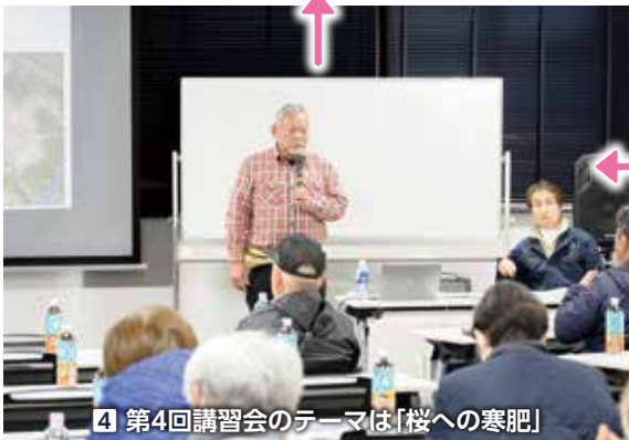
4 第4回講習会のテーマは「桜への寒肥」