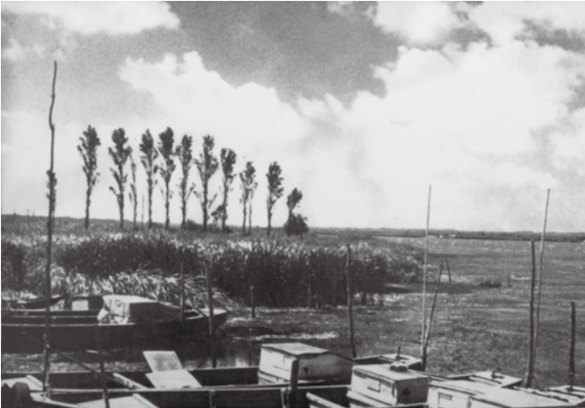
息栖大橋が架かる前の息栖の渡船場周辺