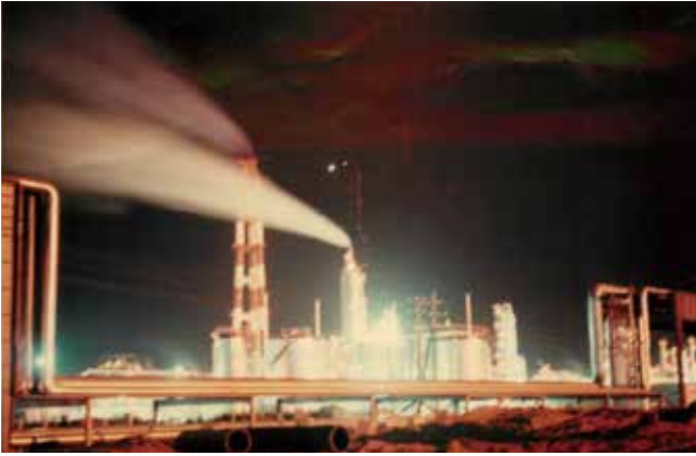
鹿島臨海工業地帯の夜景(昭和45年ごろ)