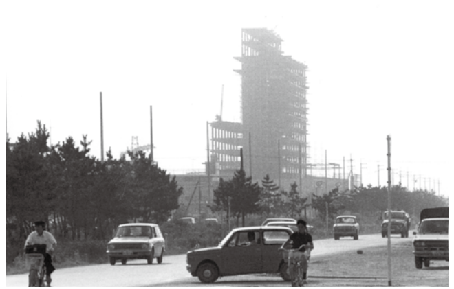
建設中の鹿島セントラルビル(昭和47年ごろ)