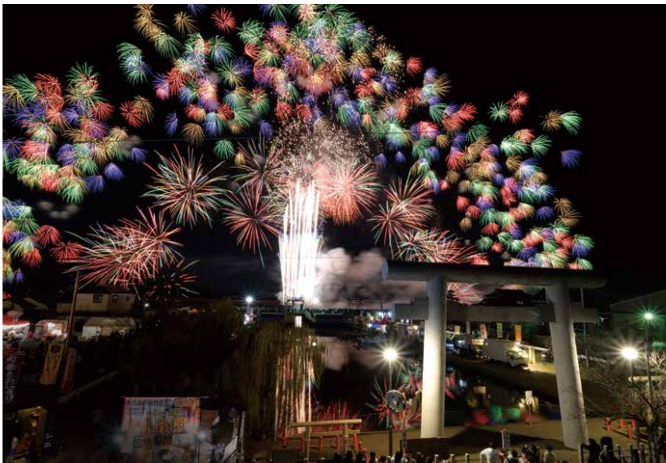
第50回を記念して息栖神社周辺で開催された神栖花火大会(令和7年11月22日)

にごみ拾いをしました。当時はまだ出かける場所も少なかったので、持ち寄った料理を囲んで家族や仲間と花火大会を楽しむのが、地元の方さんにとって一大イベントとなるような時代でした。屋台もたくさん出て、大勢の人で賑わっていましたね」