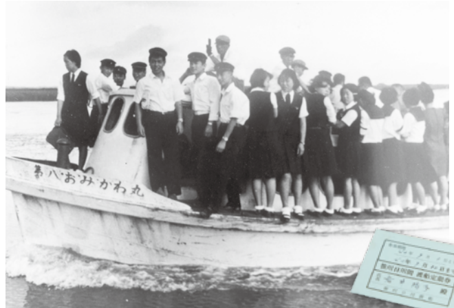
通学で混み合う第八おみがわ丸と定期券

渡船が廃止される前に同僚と乗りに行ったり、工場夜景が珍しいと車でベルコン通りを走って見に行ったりもしました。人口がどんどん増え、生徒数も多くて、1学年に8クラス、1クラスは約50人くらいで教室は満杯でした。小見川町(現在の香取市)から自転車で行って、くる生徒もいて、風雨が強い日は大変だったと思います。根性がありましたね」