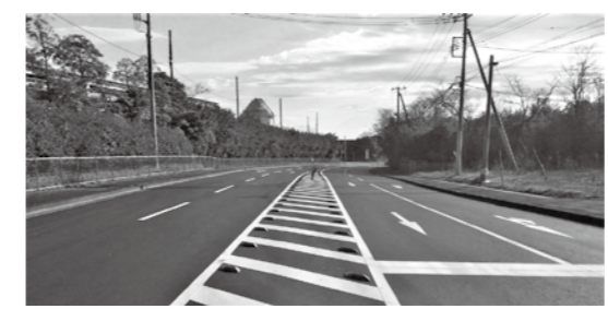
整備された市道8-105号線(東深芝地内)

石油貯蔵施設立地対策等交付金は、石油貯蔵施設の周辺地域における公共用防災施設などの整備を目的として、国から交付されます。 これまでも、この交付金で防道路、防災通信施設、環境監視施設などを整備してきました。 2025年度は1億307万2千円が交付され、これに市の一般財源1764万2千円を加え、2路線の道路を改修しました。