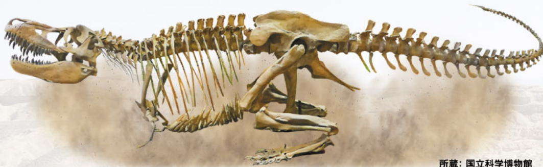
タルボサウルス全身骨格 (複製)