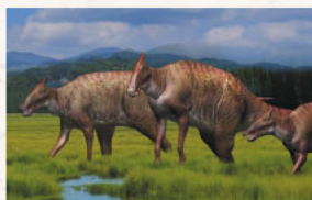
サウロロフス生態復元図