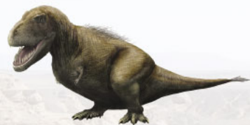
羽毛がある生態復元.