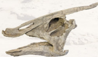
サウロロフス頭骨 (複製)

モンゴル国ゴビ砂漠から、多様な恐竜が見つかっている。肉食恐竜ではタルボサウルスやヴェロキラプトル類、植物食恐竜ではサウロロフスやプロトケラトプスが代表的。これらの化石の中には、砂嵐などにより急速に保存されたことで、巣や卵の化石が奇跡的に残っている。