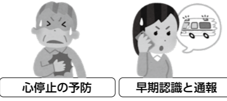
心停止の予防 早期認識と通報